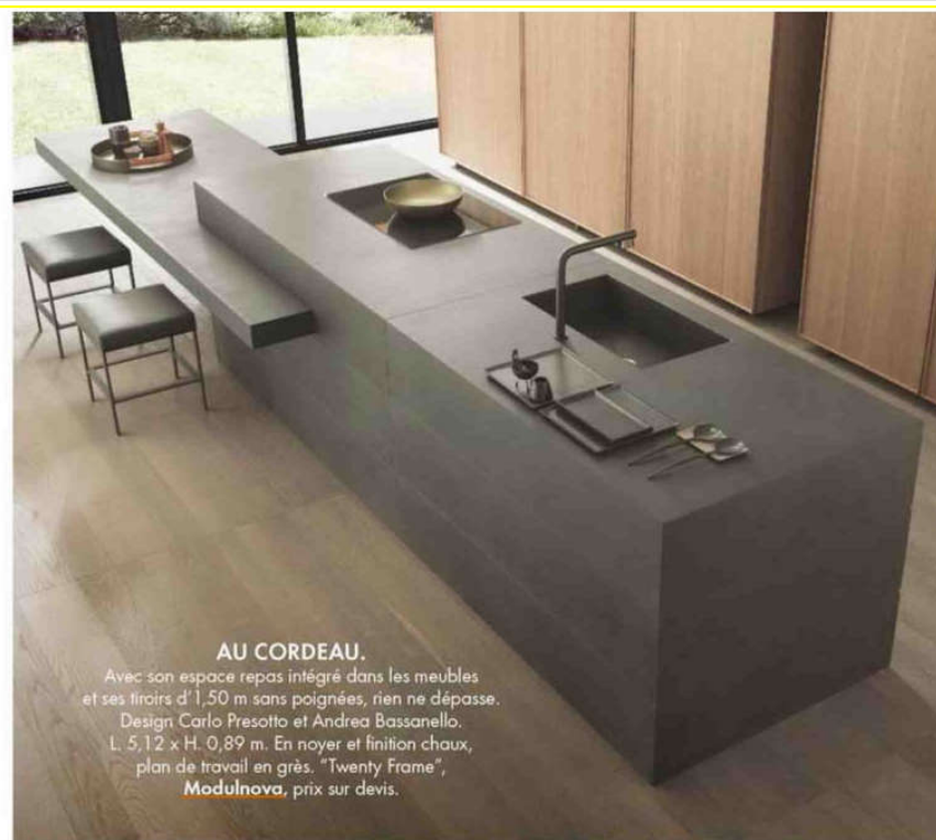
AU CORDEAU. Avec son espace repas intégré dans les meubles et ses tiroirs d'1,50 m sans poignées, rien ne dépasse. Design Carlo Presotto et Andrea Bassanello. L. 5,12 x H. 0,89 m. En noyer et finition chaux, plan de travail en grès. "Twenty Frame", Modulnova , prix sur devis.